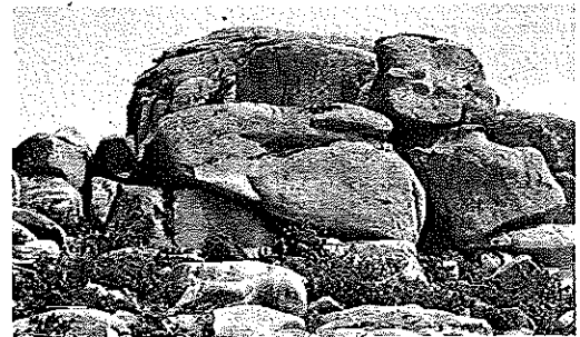
Vista del Monte Pindo