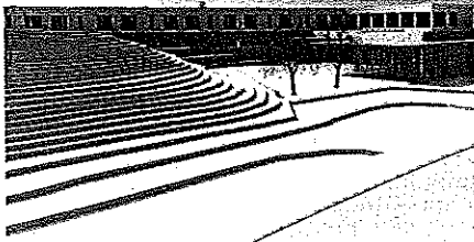
MAQUETA del Fogar dos Maiores de Cerceda