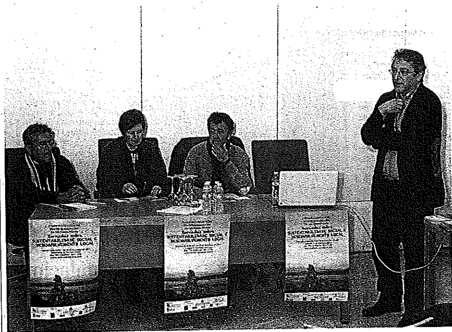
Un momento de la mesa redonda desarrollada ayer en el pazo As Torres do Allo, en el concello de Zas.

Es uno de los objetivos de Aulas, inauguradas en Zas // Este año se centran en la sostenibilidad social y en el desarrollo