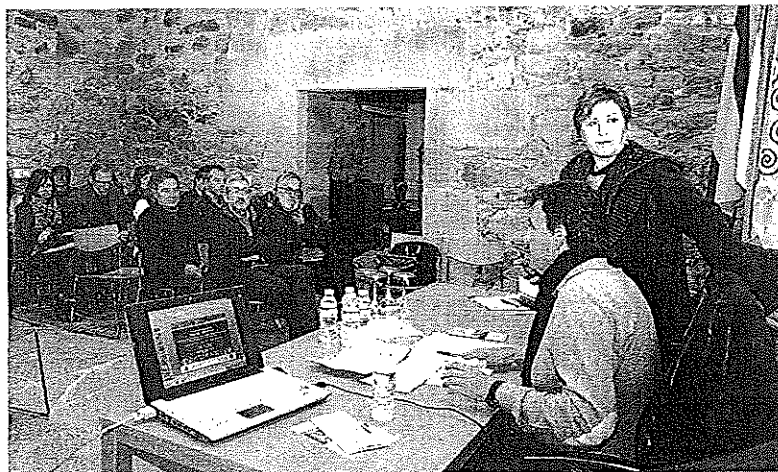
La Jornada Inaugural se llevó ayer a cabo en las Torres do Allo

Desde la asociación manifiestan: "Agradamos con esta iniciativa permitir que todas las personas que desexen estar o sábado en Caldebarcos, pero que por diferentes motivos non poidan achegarse, se poidan sentir, tamén, partícipes da defensa e goce do Monte Pindo".