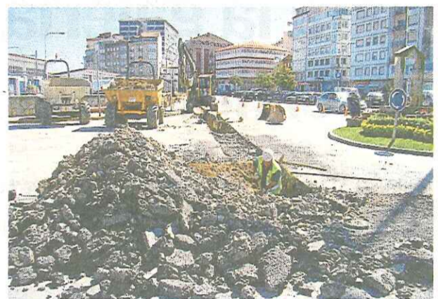
Obras de saneamiento en el centro de Ribeira.

En las últimas semanas, las obras obligaron a cortar dos carriles de la avenida del Malecón. En la actualidad se llevan a cabo frente a la plaza de la Concordia, por lo que ayer se cortó el